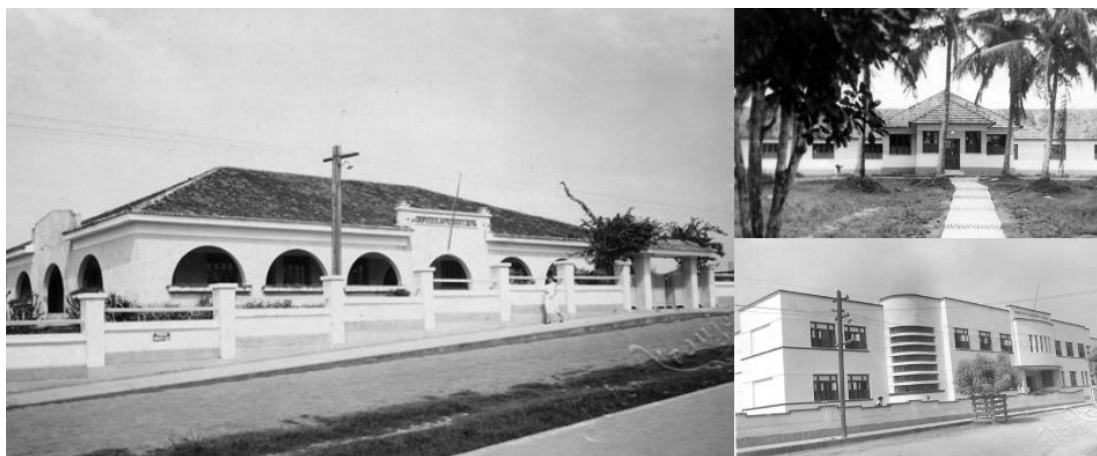
Fotos da capital Rio Branco.

(Adaptado. Fonte: https://cidades.ibge.gov.br/brasil/ac/historico – acesso em 19 de junho de 2019.)