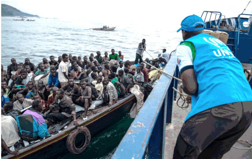
Refugiados chegam em barco lotado; foto da exposição "FACES DO REFÚGIO" — Foto: ACNUR/ Divulgação

Desse total, quase 26 milhões são considerados refugiados pelos padrões do Acnur. Síria e Venezuela são pontos de preocupação da agência. Pedidos de refúgio no Brasil dobraram em um ano.